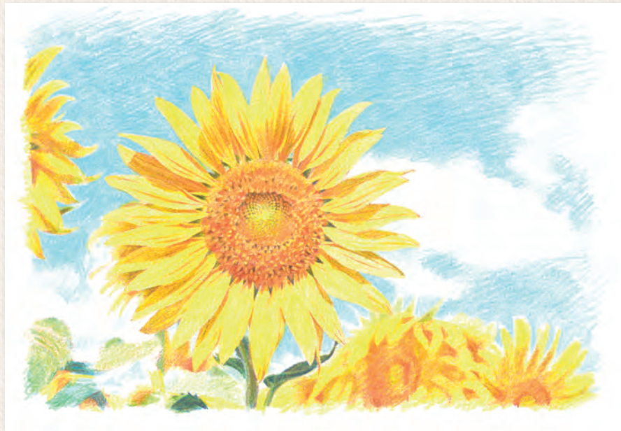
Colours used | Couleurs utilisées

Utilisez du bleu ciel pour dessiner le ciel tout en laissant les formes des nuages non colorées.